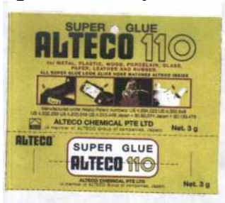
Marque n° 47307 Marque de l'opposant

Attendu que les marques des deux titulaires en conflit se présentent ainsi :