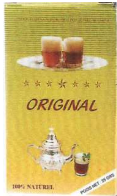
Marque du déposant Marque n° 109088

Attendu que du point de vue visuel, les marques en conflit ont en commun deux verres de thé remplis, le tout sur un plateau avec des rayures dans la même disposition et avec en dessous sept étoiles ;